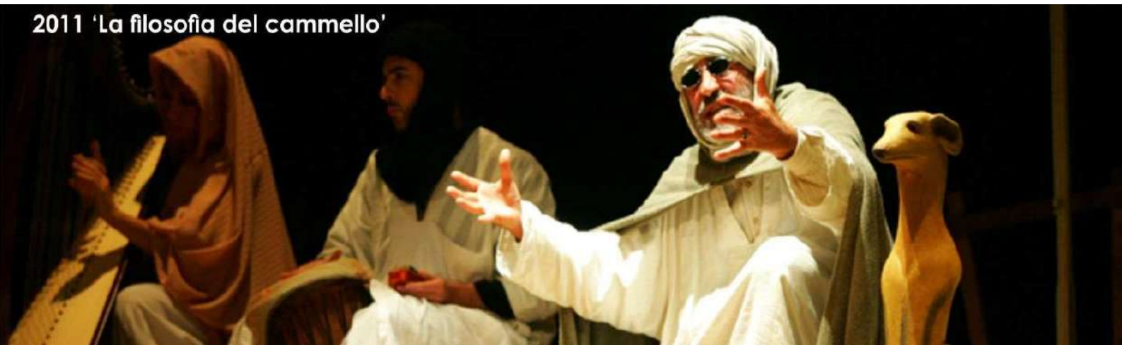
2011 'La filosofia del cammello'

Dallo spettacolo, frutto di un'esperienza di drammatizzazione condotta dall'autore e regista Aldo Sicurella all'interno del campo profughi Saharawi, nasce l'idea di un laboratorio per le scuole superiori la cui finalità è volta a sviluppare la conoscenza e lo spirito di solidarietà verso i popoli esuli dalla loro terra e capaci, nonostante tutto, di coltivare la speranza di un futuro migliore.