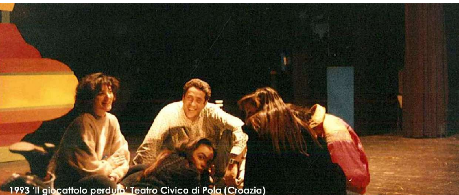
1993 'Il giocattolo perduto' Teatro Civico di Pola (Croazia)