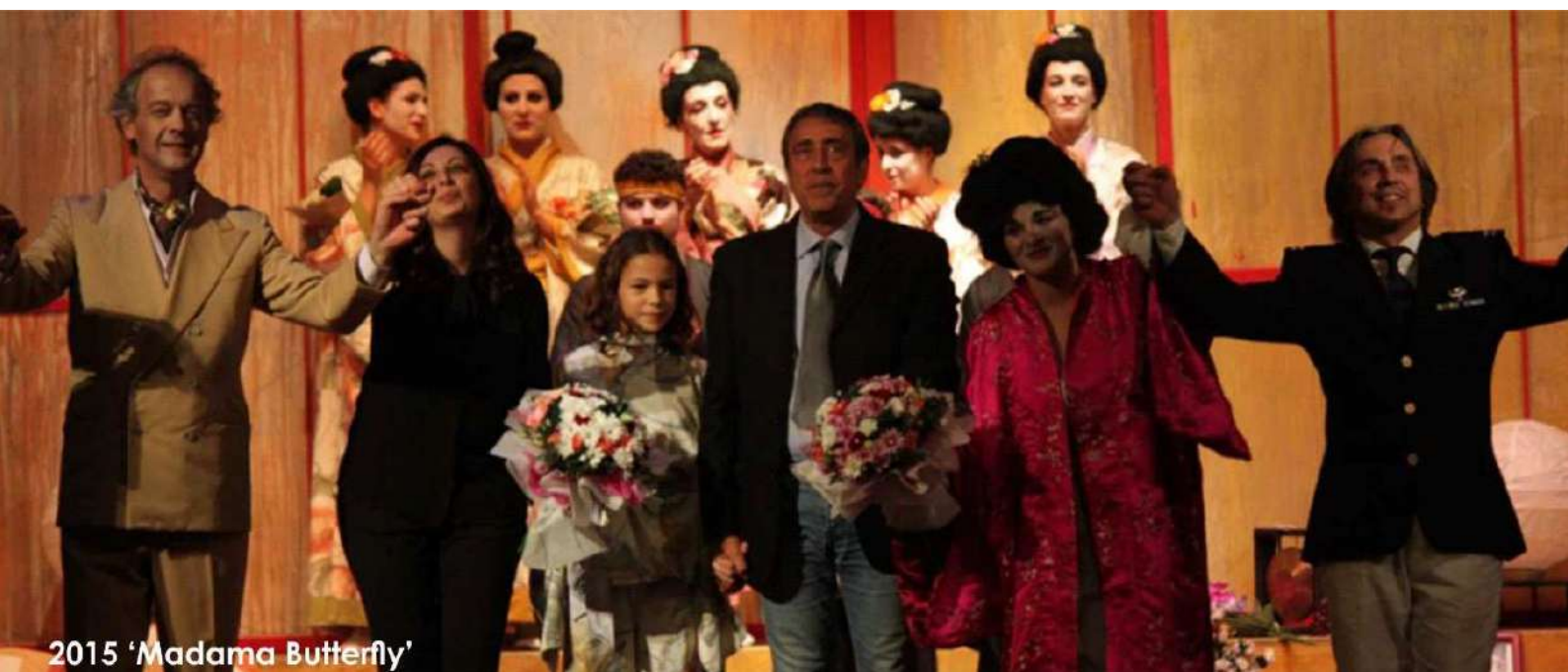
2015 'Madama Butterfly'