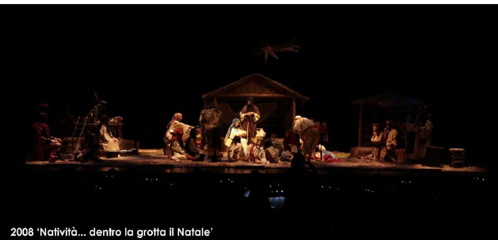
2008 'Natività... dentro la grotta il Natale'